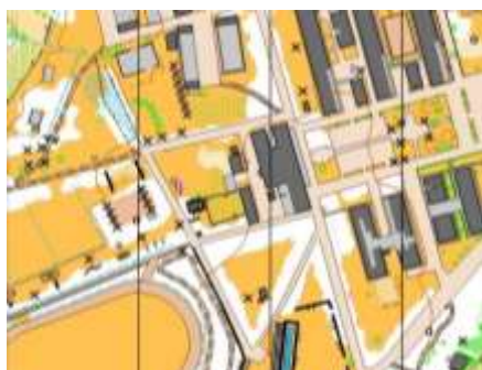
1ª Etapa - UFSM