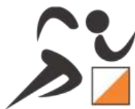
2ª Etapa – São Valentim